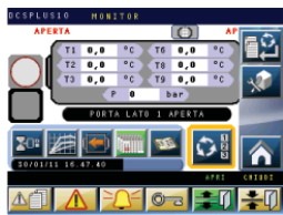
DCS PLUS 10 process controller Controllore di processo DCS PLUS 10