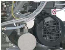
Vacuum pump Pompa del vuoto