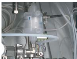
Air sterilization filter Filtro per l'aria