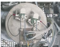
Separated steam generator Generatore di vapore esterno