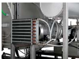
Condensate drain cooler and vacuum pump / Raffreddamento della condensa sullo scarico e della pompa del vuoto