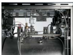
Modulating valve on steam inlet Valvola modulante nell'ingresso vapore