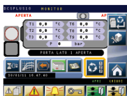
DCS PLUS 10 process controller Controllore di processo DCS PLUS 10