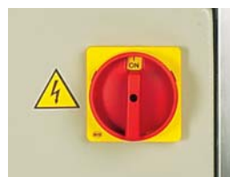
FVG - Main switch for emergency stop FVG - Interruttore principale per emergenza