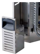
FVS - Front mounted condensate tank FVS - Tanica frontale per recupero condensa