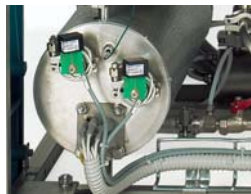
FVG & FVS - Steam generator FVG & FVS - Generatore di vapore