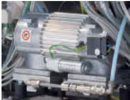
FVG - Vacuum pump FVG - Pompa del vuoto