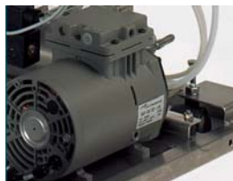
FVG & FVS - Air compressor FVG & FVS - Compressore aria