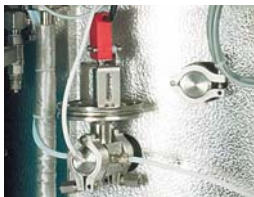
FVG - Membrane safety device for preventing lid opening even in case of minimal over pressure FVG - Dispositivo di sicurezza a membrana per evitare l'apertura del coperchio anche in case di minima sovrappressione