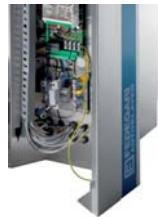
FVS - Stainless steel removable paneling FVS - Pannellatura removibile in acciaio inossidabile